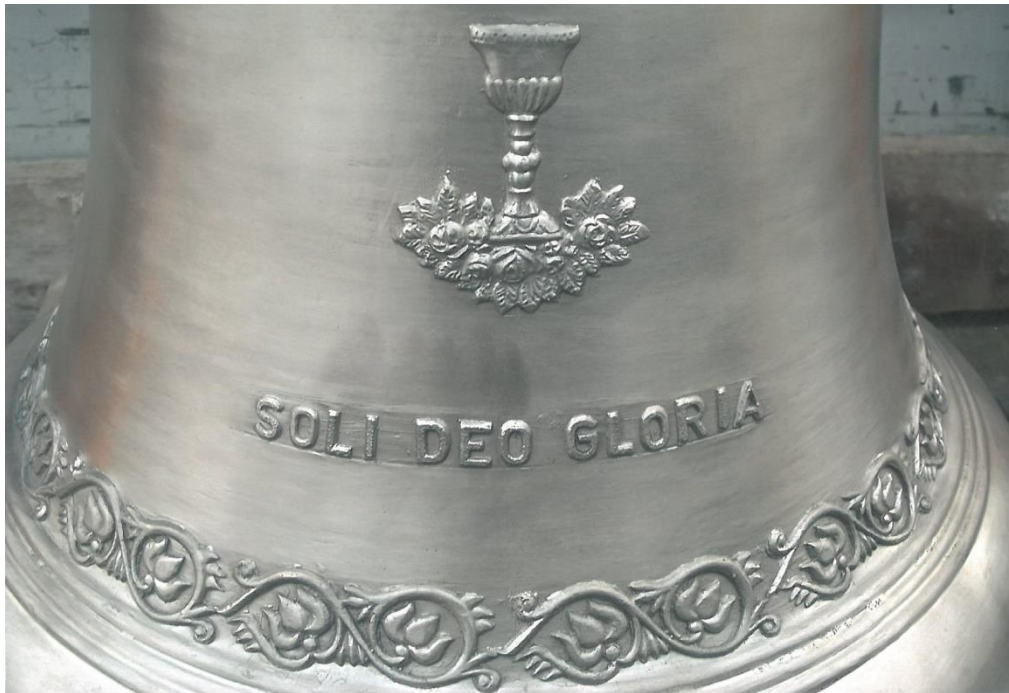
A rákoscseri Mennybemenetel templom harangjának felirata

A Rákócscsabai Református Egyházközség lapja